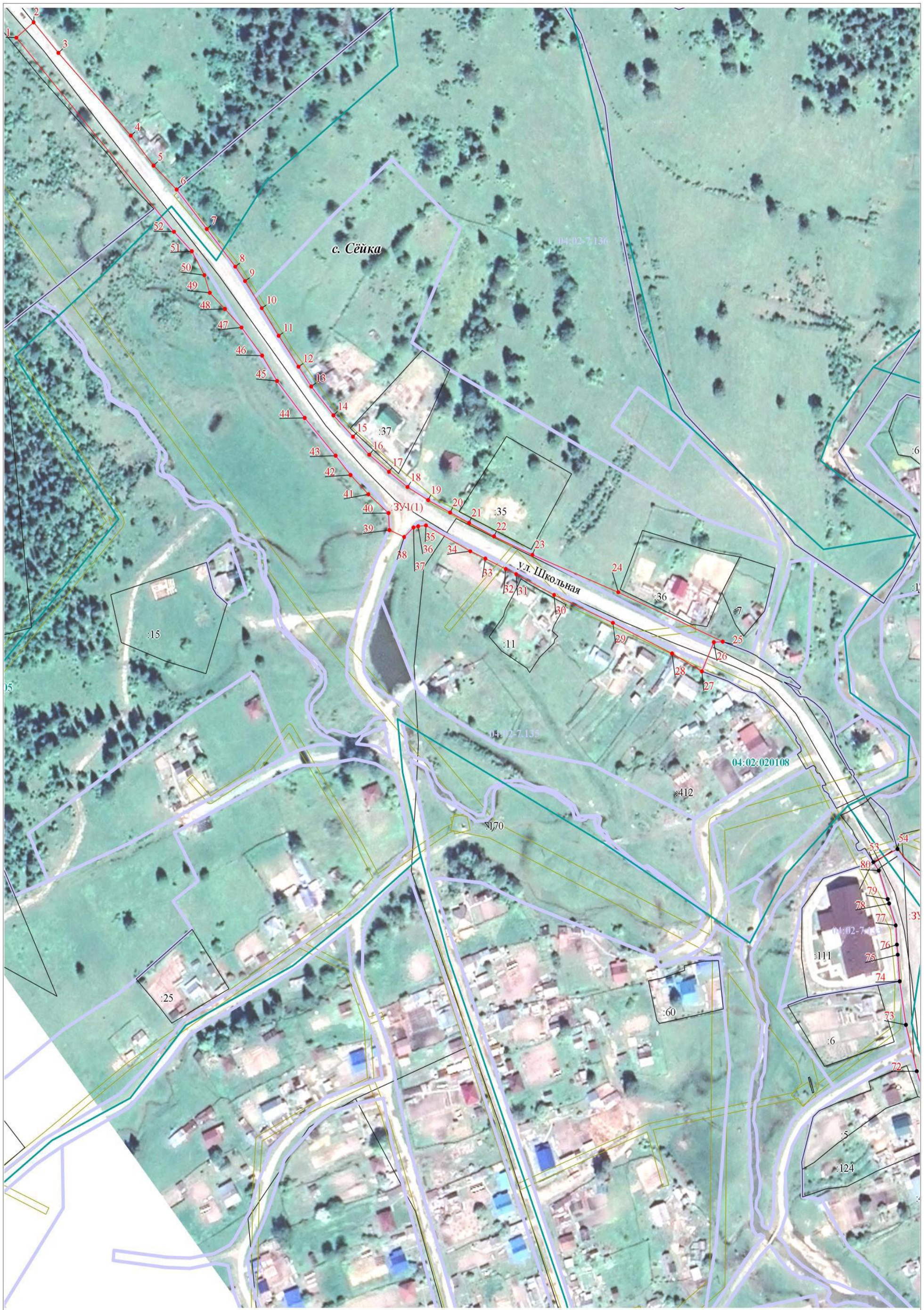
Масштаб 1:2 000