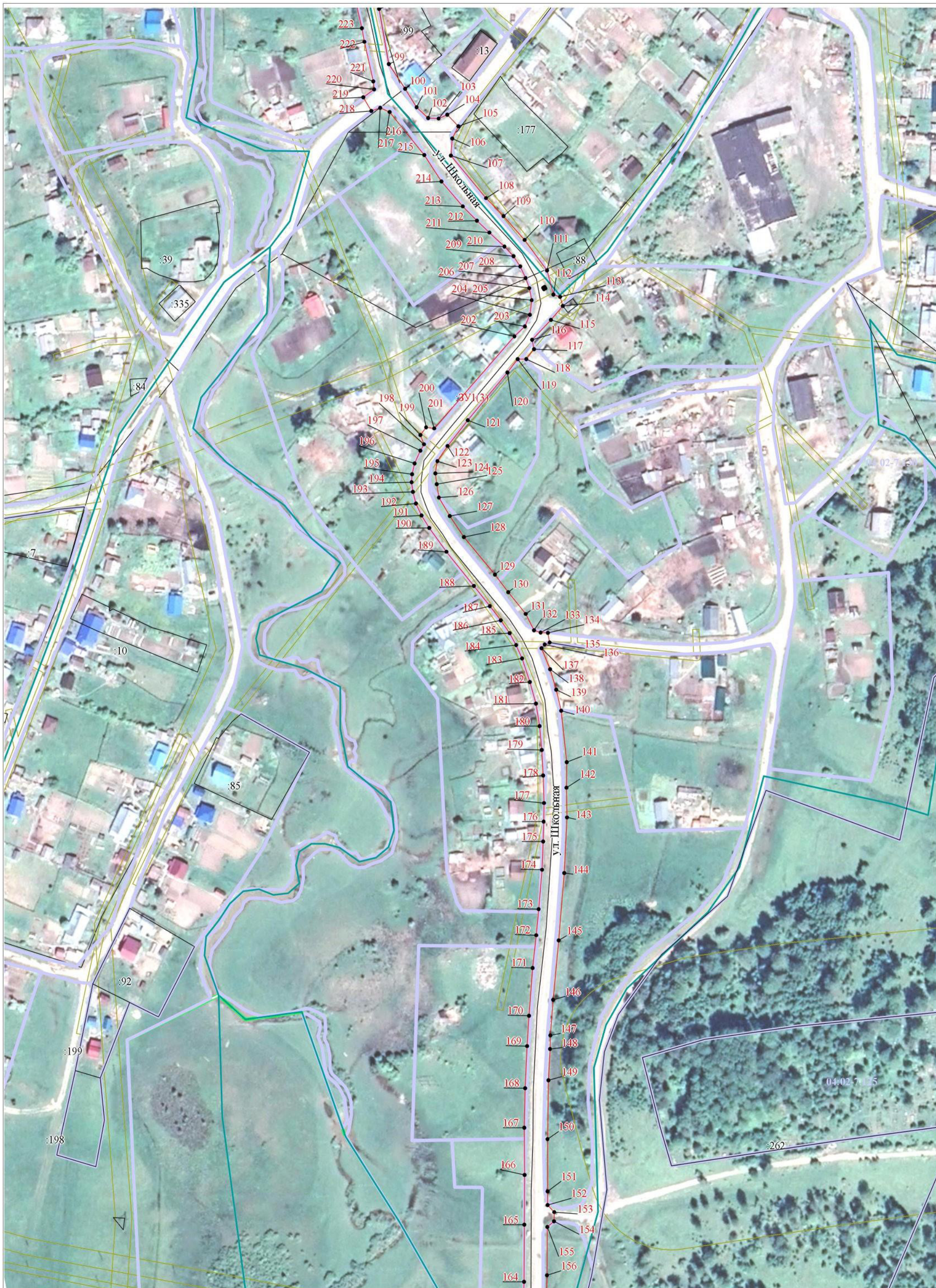
Масштаб 1:2 000