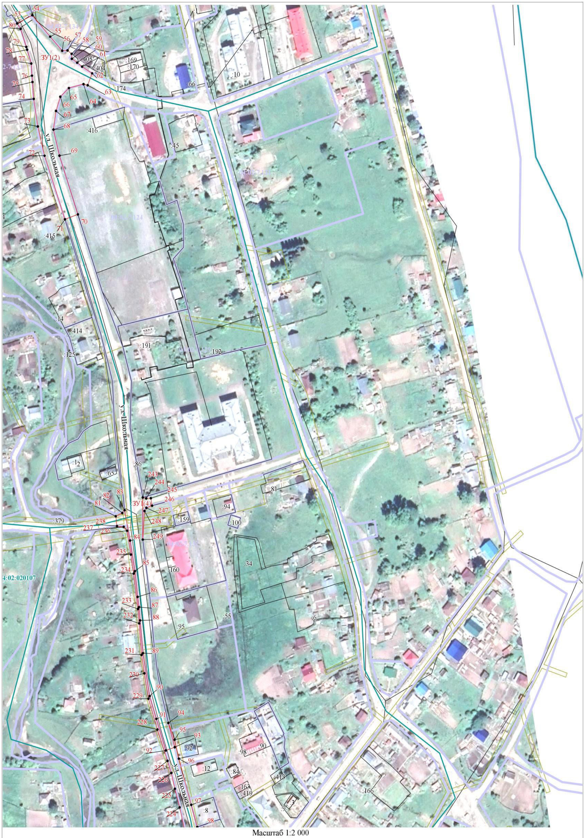
Масштаб 1:2 000